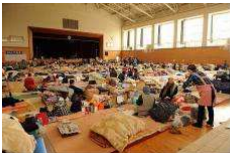
南三陸町歌津中学校校内避難所

避難所は地域の町会・自治会や婦人会、消防団が行政と連携して運営しています。選択の自由がない状況の中でも、がまん強く耐えているようにみえます。物資が手薄な避難所でも、もっと大変な避難所に物資を回してほしい、と話す方々。手作り風呂ができれば、日中がれき撤去や避難