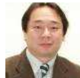
公益社団法人 Civic Force 代表理事

今回のような大規模災害の支援は、行政だけでも、企業だけでも、NGO だけでも対応しきれるものではありません。中長期的な復興に向け、Civic Force は、引き続き企業・行政・NGO の連携を活かし活動を続けます。さらなるご支援をよろしく願います。