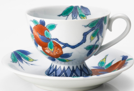
色鍋島柘榴文珈琲碗