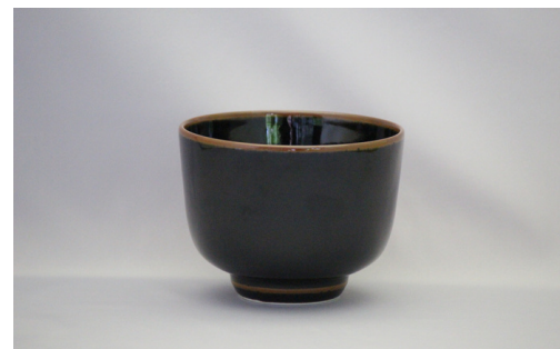
有田焼 井上萬二作 天目抹茶盃