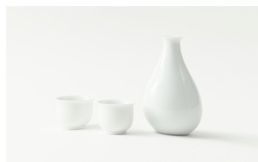
有田焼 中村清六作 白磁酒器