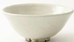
唐津焼 唐津粉引茶碗