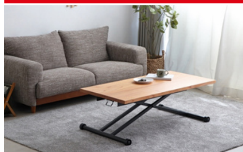
東馬家具センダンリフトテーブル東馬