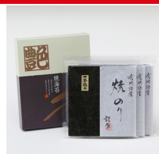
有明海産 焼のり150枚＜艶＞