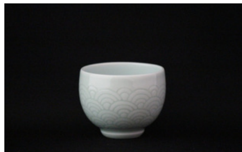
有田焼 井上萬二作