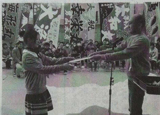
学生に卒業証書を手渡す熊谷会長④

気仙沼市唐桑町の大沢地区で、住民と防災集団移転計画などを考え合ってきた大学生を送り出す卒業式が16日、小原木中学校で行われた。1年半の間、地域に寄り添い、この春から社会人となる大学生に住民が感謝を込めて「卒業証書」を手渡した。